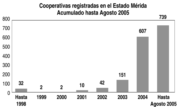
Cooperativas registradas en el estado Mérida por actividad económica Acumulado hasta Agosto 2005