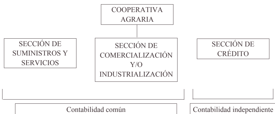
Figura 2. Organización más frecuente de las cooperativas agrarias valencianas