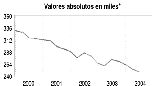
Gráfico 2. Ayudas familiares

* Datos adaptados a la nueva metodología de la EPA-2002