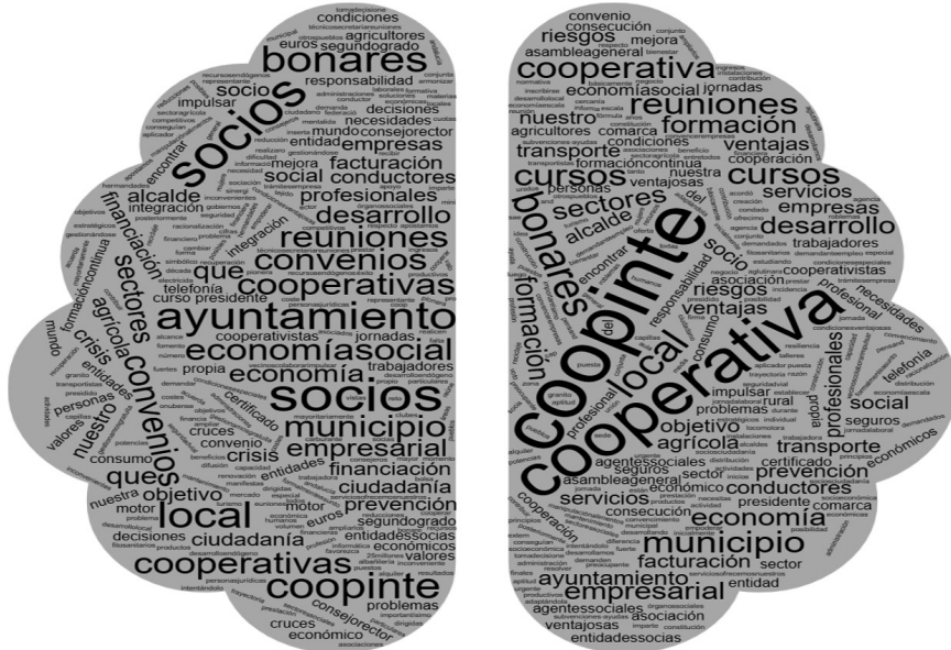
Cuadro 2. Mapa de palabras de la entrevista a la gestora de COOPINTE

Como resumen de la entrevista a la gerenta de COOPINTE, en la Figura 1, se presenta un mapa de palabras en el que se recogen los conceptos más repetidos en las respuestas y comentarios a las preguntas lanzadas. En este sentido, cabe destacar cómo la persona entrevistada recurre constantemente a palabras, tales como: cooperativa, socios, ayuntamiento, local, Bonares, reuniones, convenios, cursos, formación y economía social.